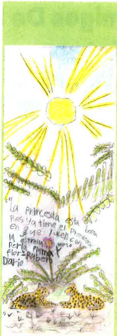
Camila Waddell Park Elementary

970-375-3385 callie.blackmer@durangogov.org